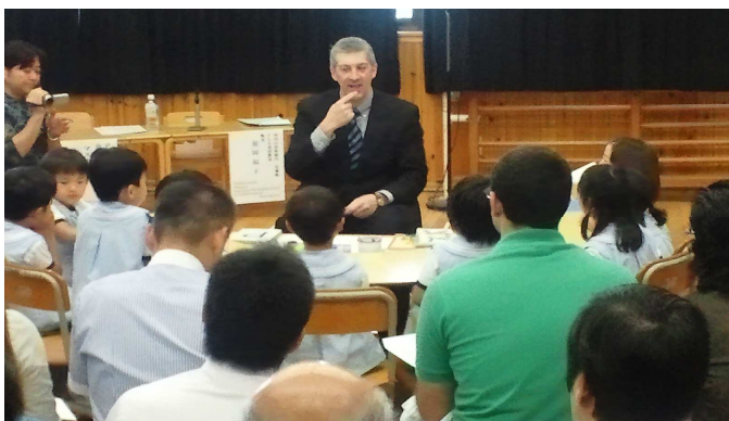
グリーン先生と生徒さんによるモデルレッスン